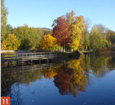
10. Au détour d'une venelle à Aÿ / 11. Les étangs du Château de Senones