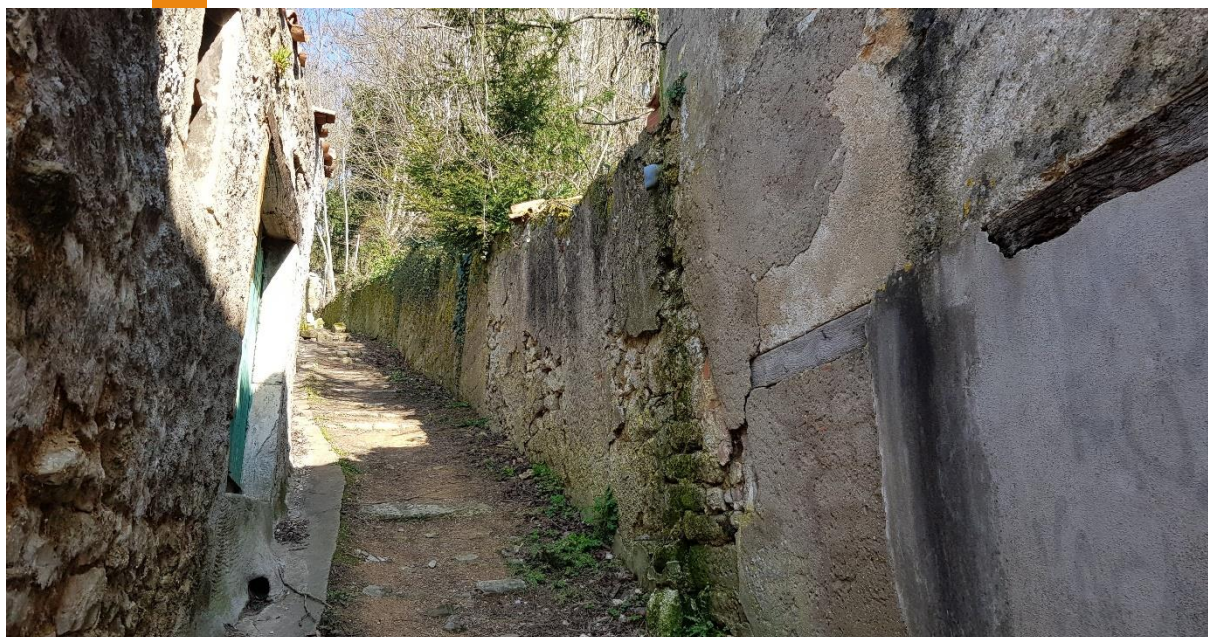
État du mur avant restauration (mars 2021)

Les chantiers, composés par des adolescents et adultes venant des quatre coins du monde et encadrés par des maçons professionnels, se sont déroulés du 12 au 30 juillet et du 2 au 20 août 2022.