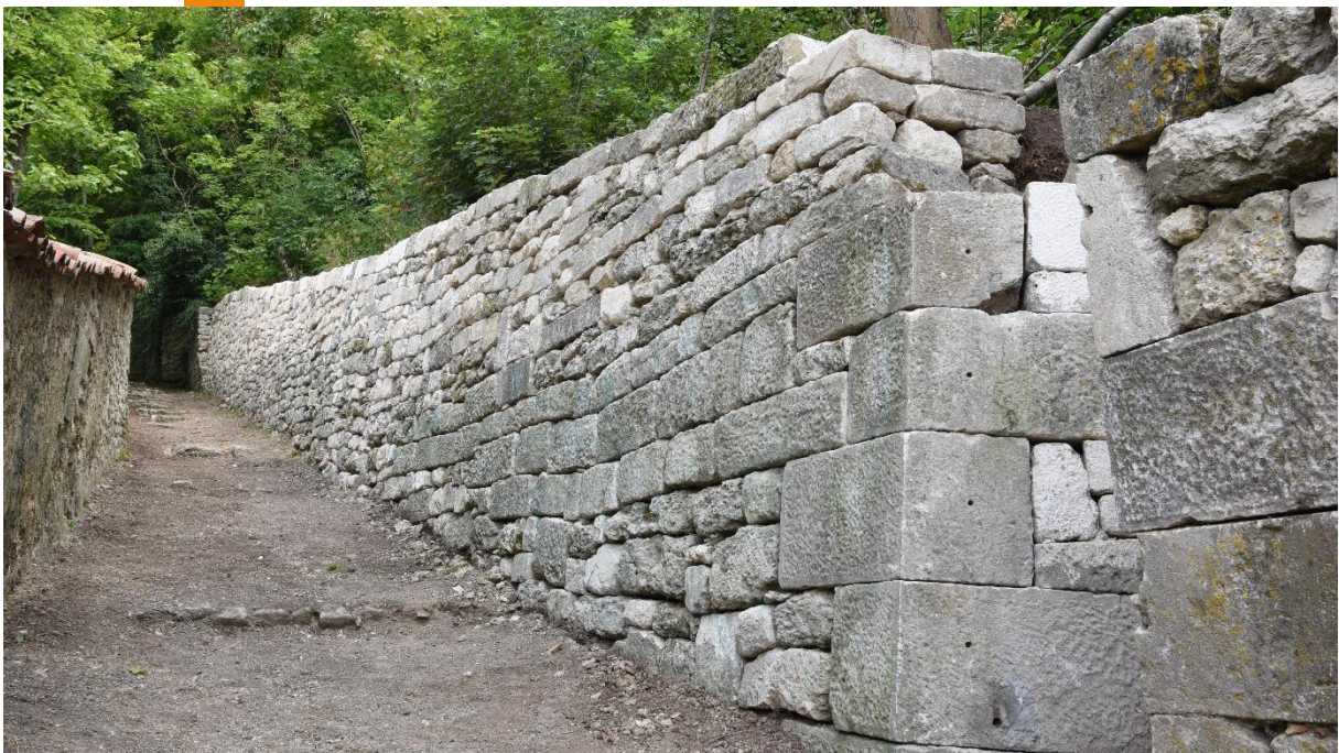
Mur en pierre sèche restauré (août 2022)