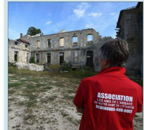
La chapelle, le logis et les murs d'enceinte sont en cours de restauration.

À Lamorville, au creux d'un vallon isolé des Côtes de Meuse, une poignée de bénévoles s'échine à sauver de la ruine l'abbaye Notre-Dame de L'Étanche, en délabrement depuis les années 1980, après avoir traversé près de dix siècles, survécu à la destruction par les armées suédoises et aux bombardements de guerre.