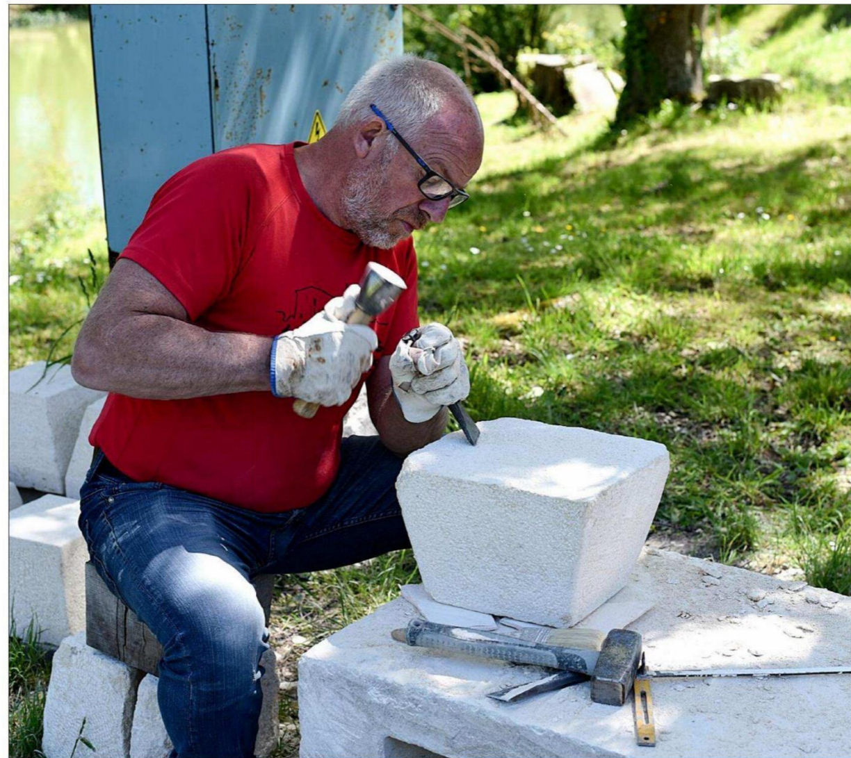
Des chantiers de taille de la pierre de maçonnerie ou encore de menuiserie médiévale sont prévus.

Inscriptions sur le site part.com et informations sur le site gombervaux.fr ou au 06 51 58 14 45