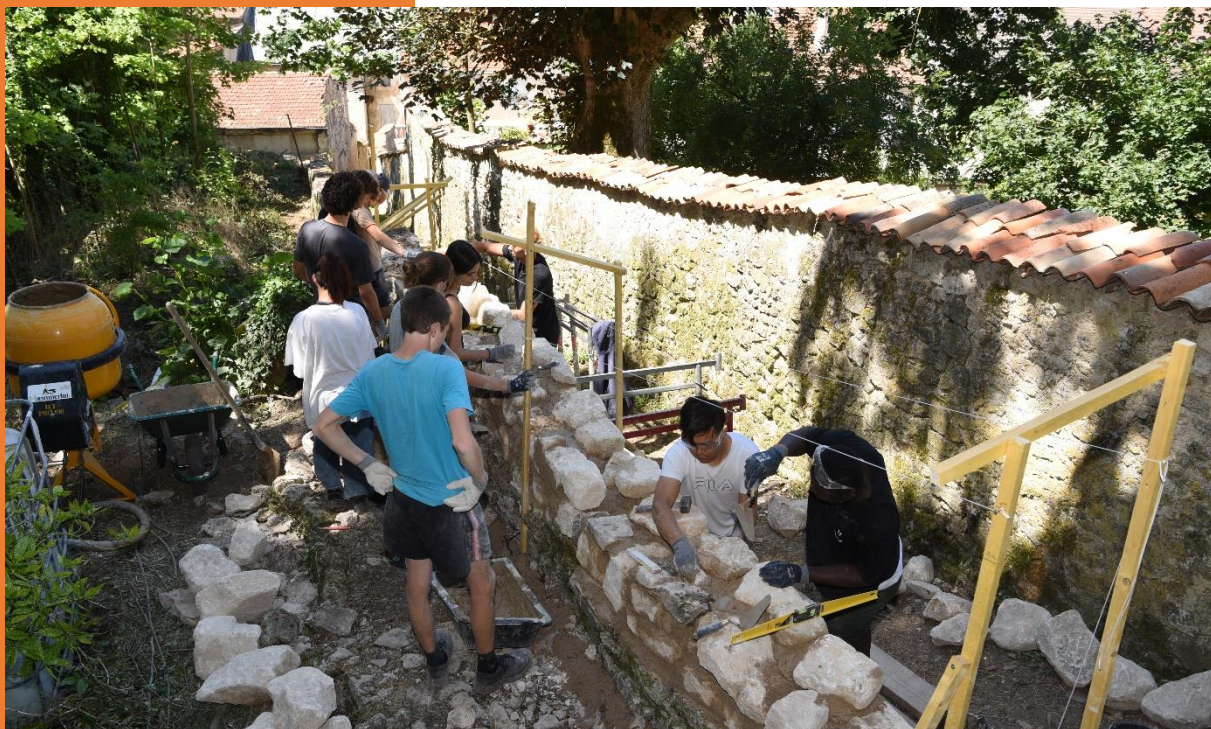
Rehaussement du mur maçonné (juillet 2022)

En outre, la restauration du mur en pierre sèche, restauré partiellement en 2021, a été poursuivie. Les pierres des derniers dix mètres furent toutes déposées jusqu'à la fondation puis replacées afin de corriger l'alignement et le fruit du mur.