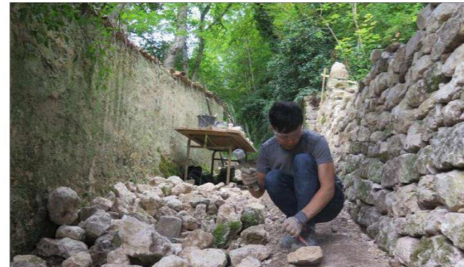
Après la promenade des Roches, des bénévoles estivaux vont s'attaquer à la promenade des Capucins.

murs en pierre sèche dans leur jardin. C'est donc une bonne occasion pour eux de s'initier à leur restauration », commente la mairie de Saint-Mihiel, qui prévoit un hébergement à l'auberge de jeunesse pour le premier chantier et sous tentes pour le deuxième. Il reste encore des places.