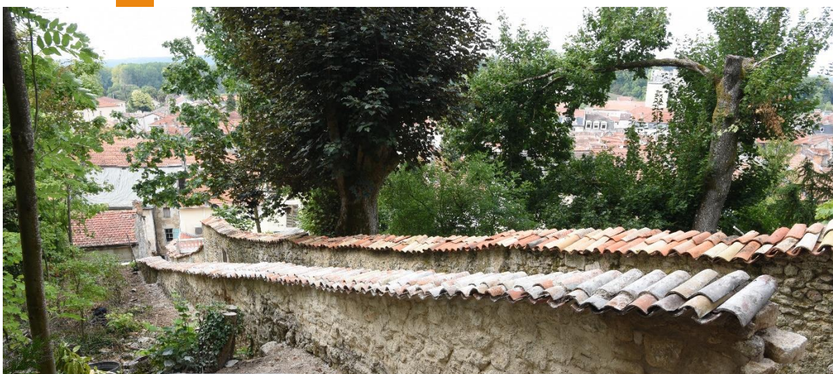
Mur maçonné restauré (août 2022)