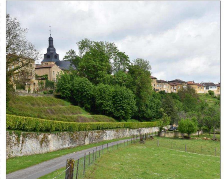
Le chantier porte sur la restauration des murs de jardins, le long du chemin de ronde de la cité Renaissance de Marville.