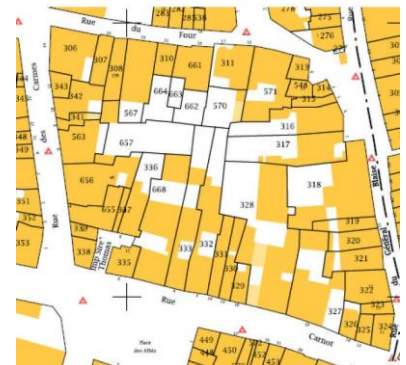
Ilot des Carmes

ZONE 3 : zone à l'extérieur de la délimitation